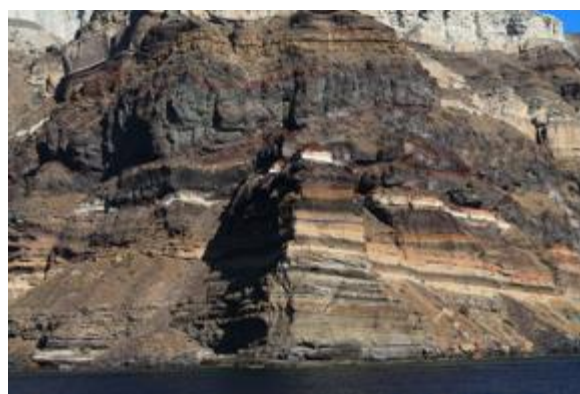
Στρώματα του εσωτερικού τοιχώματος της καλδέρας, Σαντορίνη, 2022