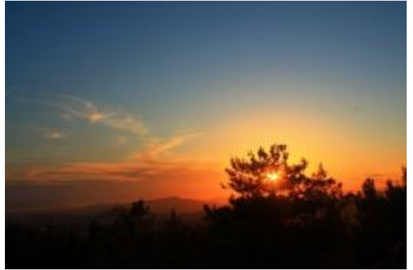
Δύση ηλίου, περίπατος στον Ύμηττό, Αθήνα, Απρίλιος 2020