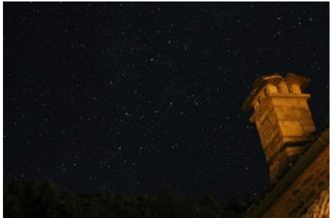
Έναστρος ουρανόσ, Πάπιγκο, Ιούλιος 2020

Τι παράξενο αλήθεια από παιδί να στοχάζομαι τον ύστατο χρόνο τη στιγμή που η γη θα συγκρούεται μ' ένα σώμα ουράνιο αστρικό και ο κόσμος θα γίνεται σκόνη.