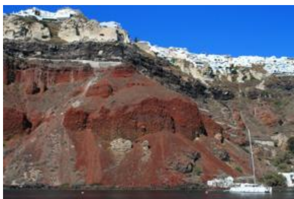
Κόκκινος Ιγκνιμβρίτης Οίας, Σαντορίνη, 2022