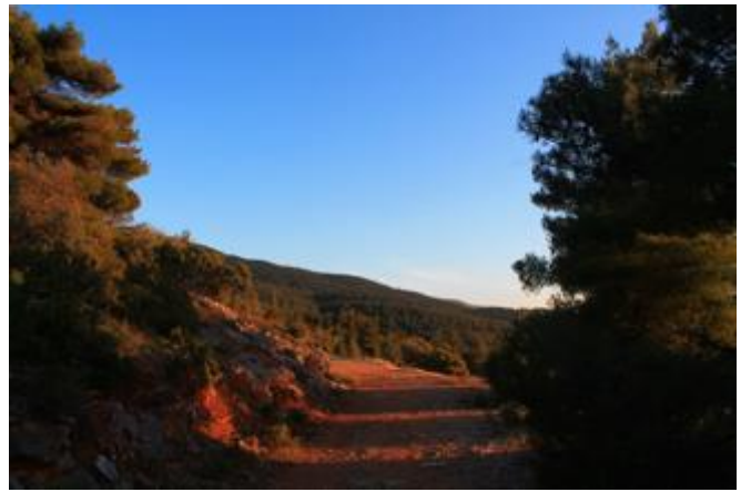
Περίπατος στον Υμηττό, Αθήνα, Απρίλιος 2020

Ξέρεις πως υπάρχει κάπου μακριά ένα βουνό –κι όμως δεν μπορείς να το δεις, Υψώνεις συχνά το βλέμμα για να μαντέψεις το περίγραμμα των κορυφών . Ωσπου μια μέρα αρχίζεις να διακρίνεις τις αιχμές τις κοιλιάδες το χιόνι. Γελώντας δείχνεις το βουνό και στους άλλους –τους απρόσεκτους. Ξάφνου όλοι μπορούν ν' ατενίσουν τα δάση τις λίμνες τους ποταμούς κι είναι περήφανοι που έχουν ένα τέτοιο βουνό δικό τους. Ένα βουνό που ήξεραν πως ήταν πάντα εκεί αόρατο σαν ένα πατέρας που λείπει χρόνια: αυτός κάποτε επιστρέφει