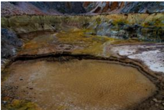
Κρατήρας Μεγάλου Πολυβώτη, Νίσυρος, 2021