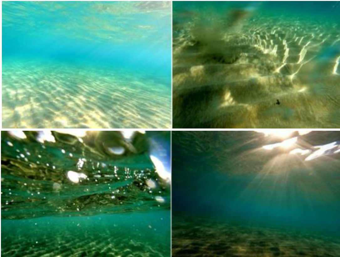
Αμμορυτίδες βυθού, Κέρκυρα, 2021

κάθοδό τους, ακολουθώντας πάντα την επαναλαμβανόμενη παλινδρομική κίνηση και τον στροβιλισμό του νερού, που αποτελεί το μηχανισμό του σχηματισμού τους. Φυσικές ρυτιδώσεις του βυθού της θάλασσας που φέρουν μια ιστορία ατέρμονης καταστροφής και αναγέννησης, κατευθυνόμενη από την συμπεριφορά του νερού.