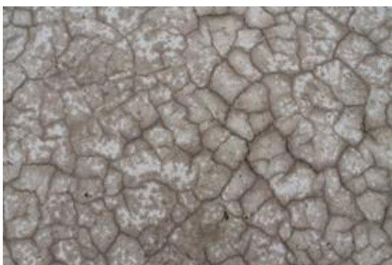
Ο αποξηραμένος πυθμένας του κρατήρα του Μεγάλου Πολυβώτη, Νίσυρος, 2021