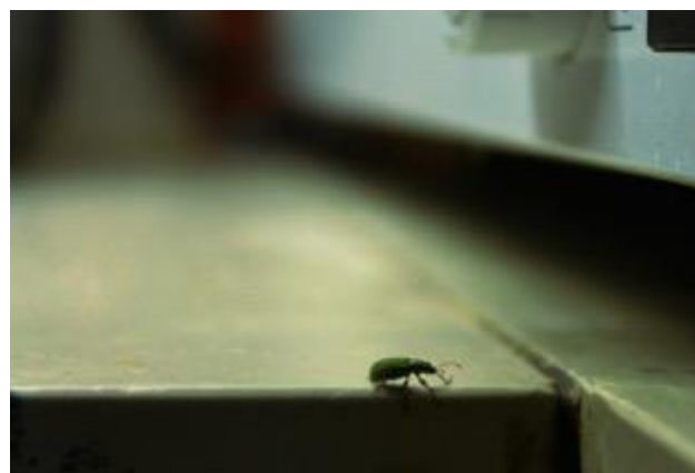
Έντομο στον πάγκο της κουζίνας, Αθήνα, Μάρτιος 2020