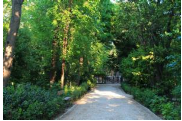
Βόλτα στον Εθνικό Κήπο, Αθήνα, Μάιος 2020

ανάβει αθόρυβα την εστία ακουμπά στη φωτιά τα φρούτα των ουρανών.