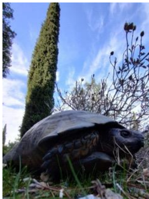
Χελώνα, περίπατος στον Υμηττό, Αθήνα, Απρίλιος 2020

που στο τέλος νικούν τις πνοές του θανάτου.