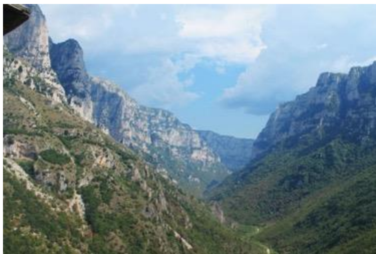
Φαράγγι Βίκου, Ζαγόρι, 2019

Ο πτυχωμένος και κάποτε νεαρός ορεινός όγκος «υπήρχε πριν και θα υπάρχει μετά από εμάς», ωρίμασε και εξελίχθηκε, ανυψώθηκε και κινήθηκε, χαραχτηκε από τη δράση των εξωγενών διεργασιών και περιμένει πια το βαθύ γήρας που του επιφυλάσσει η μοίρα, αλλά και την αναγέννηση. Οι πτυχώσεις των πετρωμάτων, τα σπήλαια, τα φαράγγια, οι χαράδρες, οι κοίτες των ποταμών, αποτελούν τα σημάδια- ζωντανές αποδείξεις που άφησε ο χρόνος σαν ρυτίδες επάνω στην γήινη επιφάνεια, στους ορεινούς όγκους και στις πεδιάδες, μέσα από σχετικά πολύ αργές γεωλογικές διεργασίες, σε αντίθεση με τις αστραπιαίες διεργασίες των ηφαιστείων που μοιάζουν να αφηφούν τον γεωλογικό χρόνο.