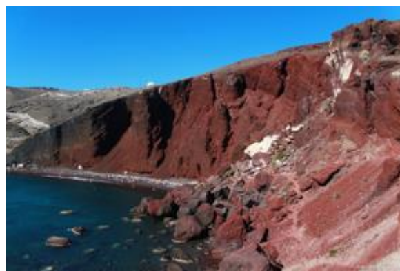
Κώνος Σκωριών Κόκκινης Παραλίας, Σαντορίνη, 2022