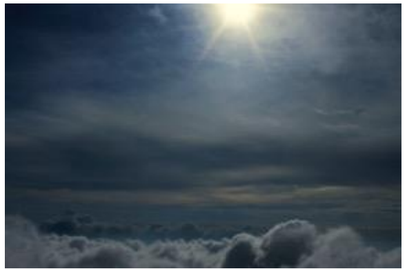
Σύννεφα, ορειβάσια στο όρος Δίρφυ, Εύβοια, Μάιος 2020