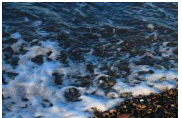
Βότσαλα στην ακρογιαλιά, Εύβοια, Ιούνιος 2020