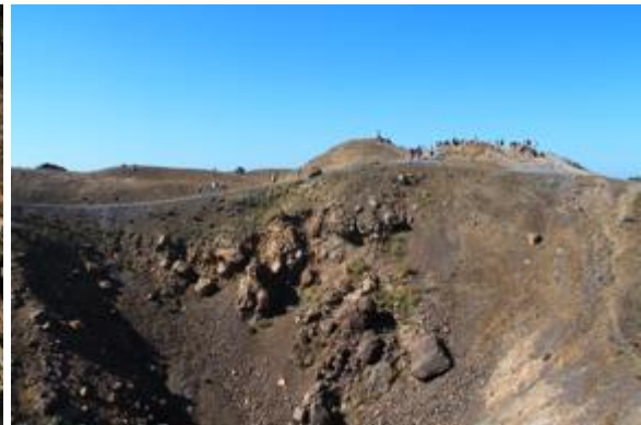
Κρατήρας Γεώργιος, Νέα Καμένη, Σαντορίνη, 2022