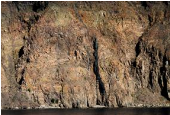
Κατακόρυφη βασαλτική φλέβα τροφοδοσίας στο εσωτερικό τοίχωμα της καλδέρας, Σαντορίνη, 2022