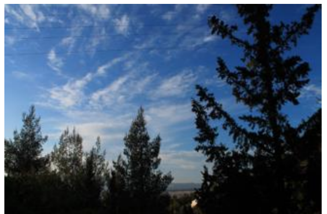
Αττικός Ουρανός, περίπατος στον Υμηττό, Αθήνα, Απρίλιος 2020