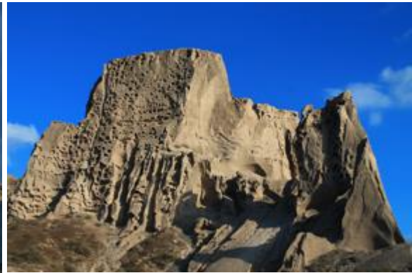
Χαρακτηριστικές γεωμορφές κυψελοειδούς αποσάθρωσης στους σχηματισμούς αποθέσεων πυροκλαστικών ροών στην Παραλία Βλυχάδας, Σαντορίνη, 2022