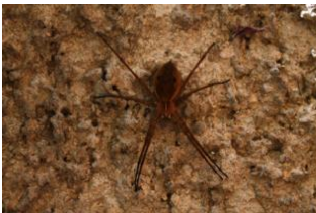
Αράχνη στην αυλή του σπιτιού, Αθήνα, Απρίλιος 2020