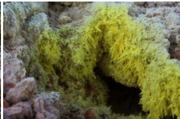
Φουμαρόλη, Νίσυρος, 2021